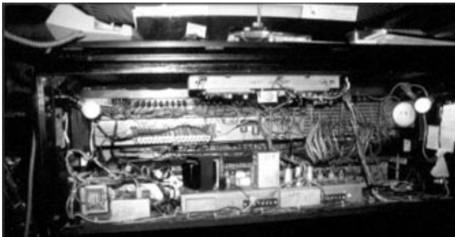
Le C-3 de Raymond Delage vu de l'intérieur.

L'orgue Hammond, déjà entré dans l'histoire de la musique, est en train de devenir un nouvel instrument spécifique à part entière.